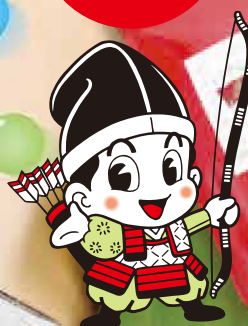
イメージキャラクター 与一くん